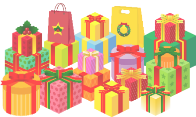
プレゼント交換はゲームで

今年4回目で最後の例会に37名が参加。ミニクリスマス会での「奈良県の市町村名を25個記入するビンゴゲーム」では意外に名前が出てこず、次の「アルファベット6文字で英単語を作ろう」のゲームではグループに分かれ大いに盛り上がりました。それぞれが「コロナが収束したらやりたい事」のメッセージをつけて用意したプレゼントを交換し、楽しく1年を締めくくる事が出来ました。