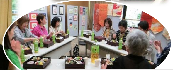
会議室定員オーバーで、入りきらない奈良メンバーは別室で食事