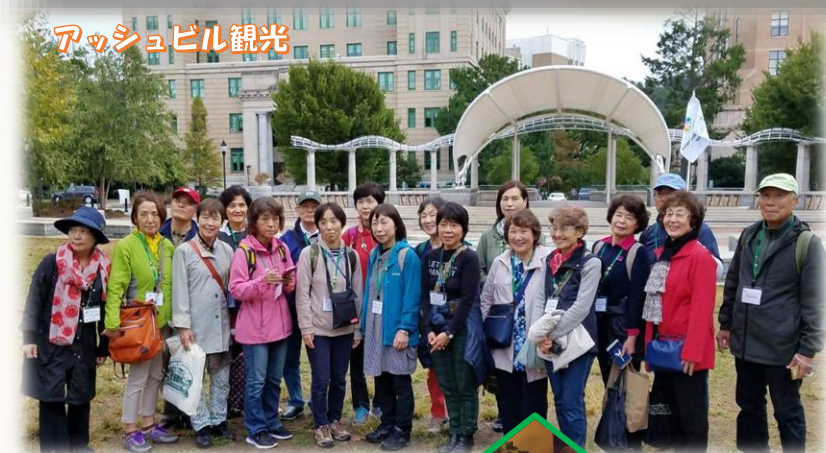
アッシュビル観光