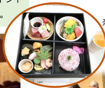
「いそじ」の松花堂弁当 奈良会員手作りお菓子 コーヒーでしばし 和やかに歓談