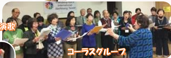
コーラスグループ