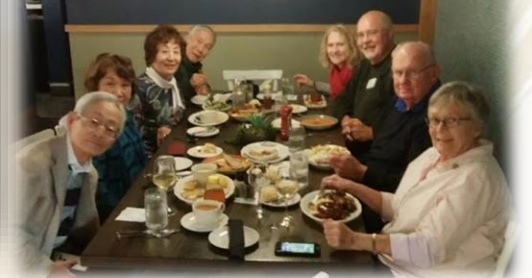
グループに分かれてサンクスディナー