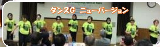
ダンスG ニューバージョン