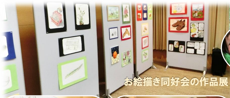
お絵描き同好会の作品展