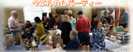
ウエルカムパーティー