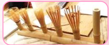
お弁当の後お茶席へ