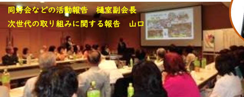
同好会などの活動報告 樋室副会長 次世代の取り組みに関する報告 山口

後半は主催クラブのプレゼンテーションとして奈良クラブの「同好会などの活動」と「次世代の取り組み」をパワーポイントで説明。活発な活動の様子を羨ましいとの声も有りました。