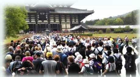
東大寺は予想以上の混雑