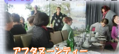
アフタヌーンティー