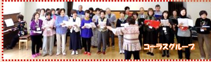
コーラスグループ

色々なパフォーマンス、席替えトークンなどバラエティーに富んだプログラムで盛り上がり、最後に全員で大和路ラプソディを踊り、楽しい時を過ごしました。