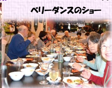
みんなのダンスで最高に盛りました。