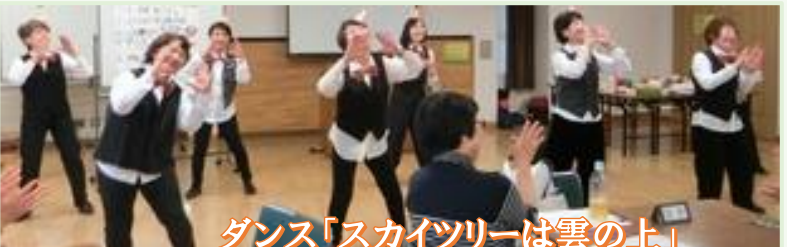
ダンス「スカイツリーは雲の上」