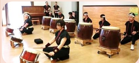
和太鼓演奏 せいか太鼓「波布理」