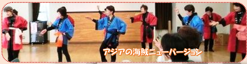
アジアの海賊ニューバージョン

Cornwall クラブから「奈良鹿愛護会」に寄付。奈良クラブからはテーブルランナーを贈りました。