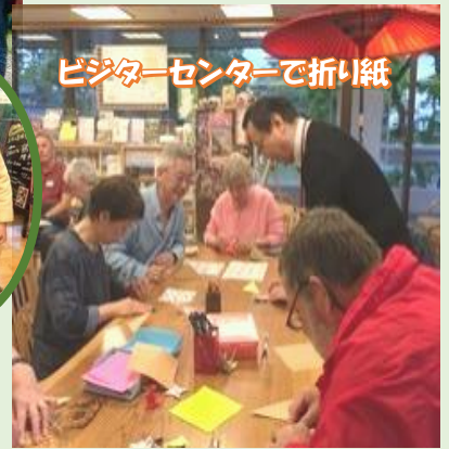
ビクターセンターで折り紙