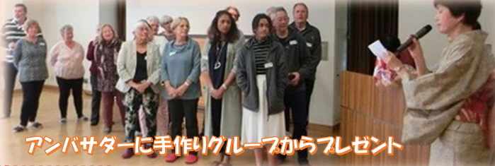
アンバサダーに手作りグループからプレゼント

Cornwall クラブから「奈良鹿愛護会」に寄付。奈良クラブからはテーブルランナーを贈りました。