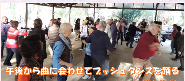
午後から曲に合わせてフッシュダンスを踊る