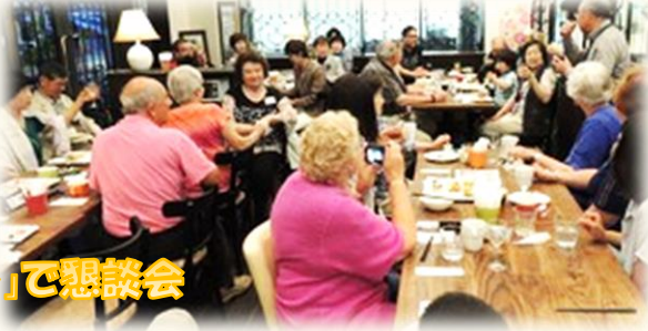
「アルション」で懇談会