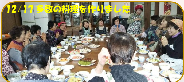
12/17 多数の料理を作りました