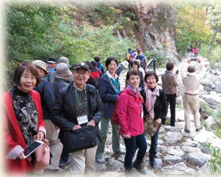
8日は1泊旅行でホテル泊