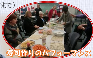
寿司作りのパフォーマンス