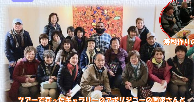
ツアーで寄ったギャラリーのアボリジニーの画家さんと