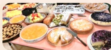
会員手作りの豪華な料理、スイーツがずらり並びました!