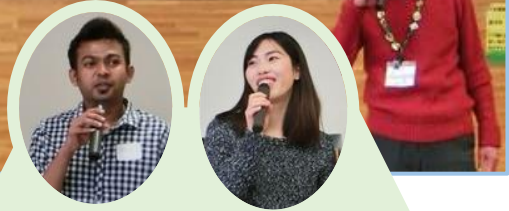
スリランカ、ベトナム、ミャンマー、マレーシア、ネパールからの留学生