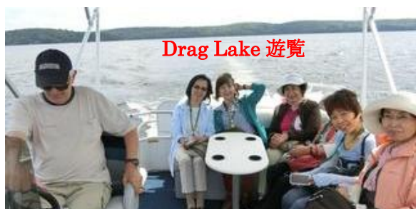
Drag Lake 遊覧

森と湖に囲まれた美しい街、カナダ・ハリバートンに奈良クラブ 25 名がステイしました。参加人数が多くしかも一日多い滞在でしたが終わってみれば素晴らしい交流となりました。特に奈良クラブ初めての試みとして、“Japanese Day” を設け、ホストやお世話になった人達に日本食を作って食べて頂き、クラフト体験や日本の歌、踊りなど披露し和気藹々の中、感謝を伝えられたひとときでした。大自然の中、心豊かに暮らす人達と触れ合えた時間は忘れられないものとなりました。