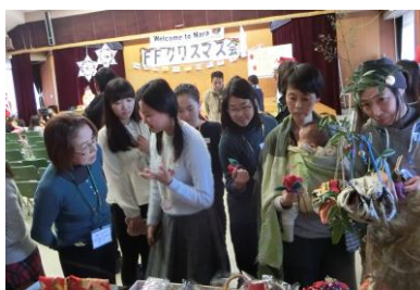
“バザーは大賑わい”